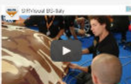
Corsi Work & Doce 2015 3M Convegno Interior Design Video Presentazione Corsi 2015