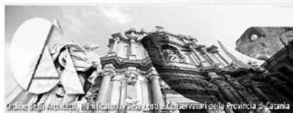
Ordine degli Architetti, Piacentini, Paesi edili e Conservatori della Provincia di Catania

«Criticità e opportunità: come valorizzare il lavoro dei professionisti». Scannella: dalla riforma delle professioni alle prestazioni di pubblico interesse, ecco le nostre istanze