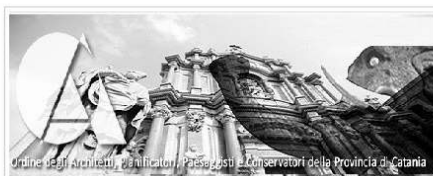
Ordine degli Architetti, Pianificatori, Paisaggisti e Conservatori della Provincia di Catania

Accreditato Regione Siciliana euro 950,00 a persona